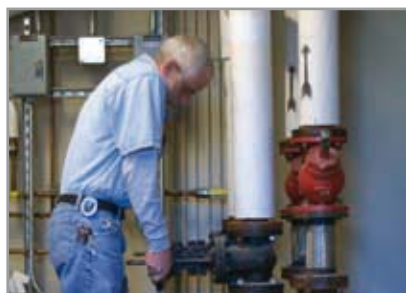
De SpiroVent Superior verwijderde enorm veel lucht in de opstartfase, waardoor er zeer snel kon worden ingeregeld.

Bij het internationale vliegveld in Barcelona is een compleet nieuwe terminal gebouwd met een totale effectieve oppervlakte van 525.625 m 2 . Bij het ontwerp van de klimaattechnische installatie is er veel aandacht besteed aan efficiëntie en duurzaamheid. Daarom zijn er 23 SpiroCombi's geplaatst die de installatie constant ontdoen van de aanwezige gassen en vuildeeltjes. Op deze manier draagt Spirotech bij aan een prettig binnenklimaat op deze Spaanse luchthaven.