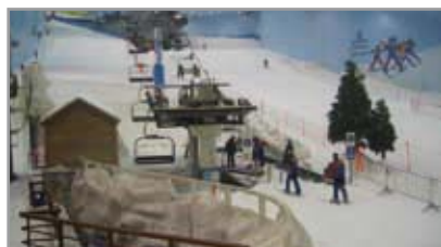
's Werelds eerste zwarte indoorskipiste is mede mogelijk gemaakt door Spirotech-toepassingen.

In een kantoorcomplex bedient het verwarmingssysteem een groot aantal ruimtes. Door de typische leidingloop met veel horizontale, versprongen leidingen en de gebruikte inductieplafonds zijn de systemen moeilijk te ontlichten. Daarom werd de SpiroVent Superior ingezet. Deze verwijderde tijdens de opstartperiode maar liefst 1000 liter lucht uit het systeem. Door deze ontlichting kon de installatie zeer snel ingeregeld worden.